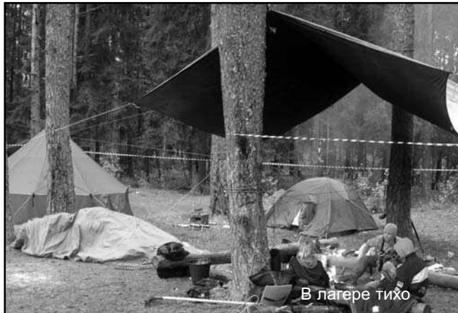
В лагере тихо