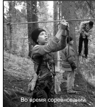
Во время соревнований