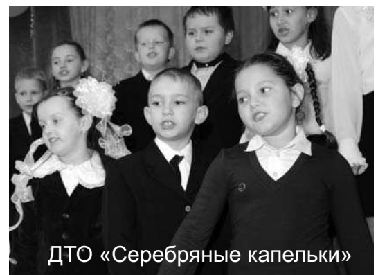
ДТО «Серебряные капельки»