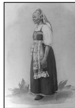
Костюм ижорской женщины